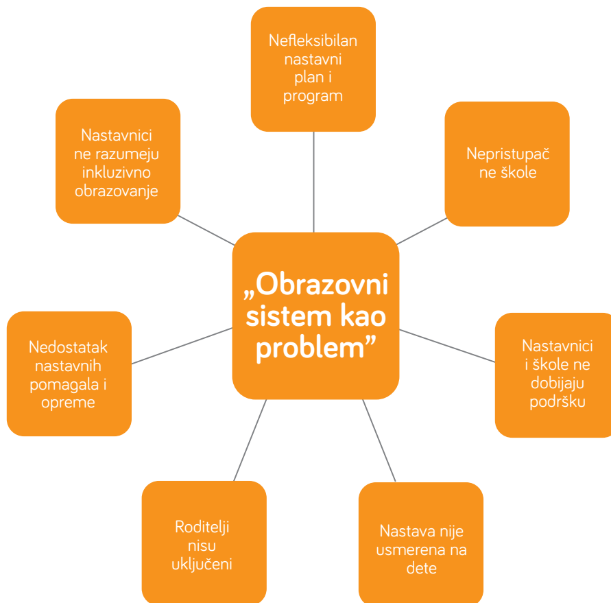
Dijagram „Obrazovni sistem kao problem“. 14