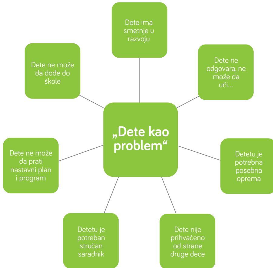
Dijagram „Dete kao problem“. 12

U poslednje vreme, problem se više ne vidi u pojedinačnom detetu, već se traži u samom sistemu obrazovanja. Takvo gledište se ponekad naziva stav usmeren na nastavni plan i program 15 . Teškoće u obrazovanju se definišu na osnovu usluga i aktivnosti koje se deci nude i na osnovu uslova koji se stvaraju u školi i zajednici. Ključne pretpostavke su: